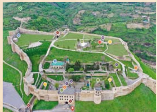
АРХИТЕКТУРНЫЙ КОМПЛЕКС ЦИТАДЕЛЬ НАРЫН-КАЛА

И тот, кто посетит древний город, познакомится с его историей, надолго запомнит дни, проведенные в этом удивительном городе легенд, городе-музее на берегу Седого Каспия.