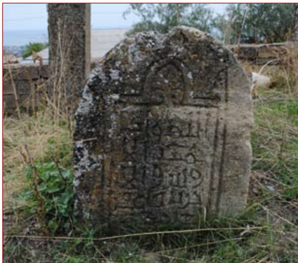
Надпись на торце саркофага на захоронении Джум-Джум.

Надписи на надгробиях не сохранились, что свидетельствует об их древности.