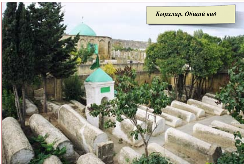
Кырхляр. Общий вид

Комплекс представляет собой часть северного городского кладбища, обнесенного каменной оградой. Огражденный участок состоит из двух примыкающих друг к другу длинными сторонами прямоугольников с внутренними размерами 12,7×17 м и 4×8,5 м. В пределах большого отсека расположены в три ряда сорок древних сундукообразных каменных надгробий. В меньшем отсеке – в один ряд восемь надгробий.