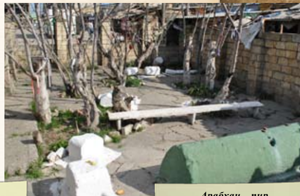
Арабхан – пир

Пирами (зияратами) служили и отдельные объекты: Гяр-даш (глухая скала), Еттиго-юлар (семь колодцев), Эмджегли-пир и др.