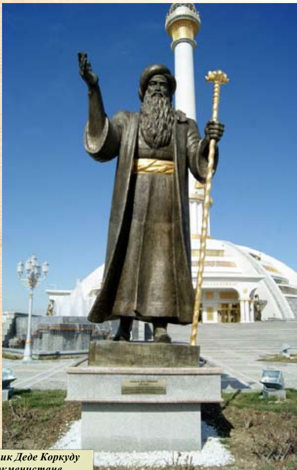
Памятник Деде Коркуду в Туркменистане

деждой на выздоровление с помощью святого Али. Этот камень некоторые археологи относят к так называемым чашечным камням, имевшим религиозное значение в глубокой древности и игравшим, вероятно, роль при жертвоприношении».