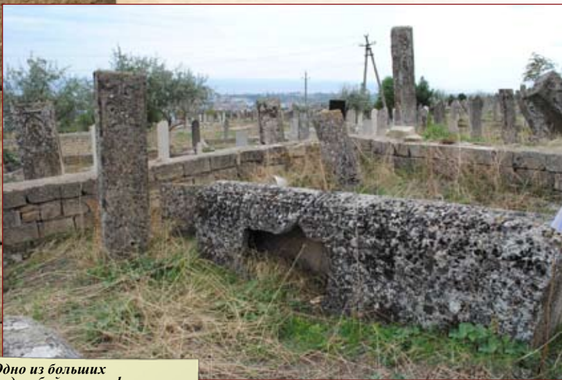
Одно из больших надгробий – саркофагов

и светлыми помыслами приходит к его святой могиле, всегда получает радость исполнения своих желаний.