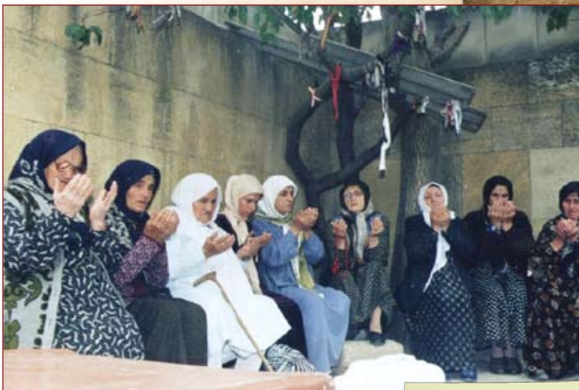
Молитва на Кырхляре

Если в местных исторических хрониках (в частности, «Дербент-наме») могильник приписывается 40 шахидам-арабам, погибшим в VII в., то цветущее куфи, которым нанесены надписи на полуцилиндрических горизон-