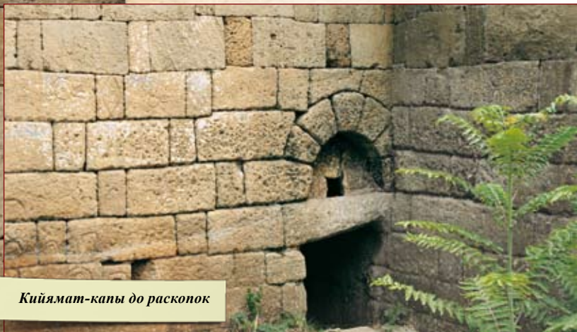
Кийямат-капы до раскопок

Побывавший в Дербенте в свите Петра I во время Персидского похода (1722 г.) ученый и политический деятель Дмитрий Кантемир среди прочих достопримечательностей города сообщает: «... существовали еще подземные ворота с непонятными изображениями и, по объяснению местных жителей, они когда-то были по высоте равны с другими, а затем постепенно осели» и, по бытовавшему у местного населения поверью, когда они полностью уйдут под землю, наступит конец света (кийямат). Отсюда и название ворот – Кийямат-капы. О том, что это древнее святилище почиталось еще в давние времена, приверженцами домусульманских вероисповеданий, свидетельствуют выбитые в стене во множестве