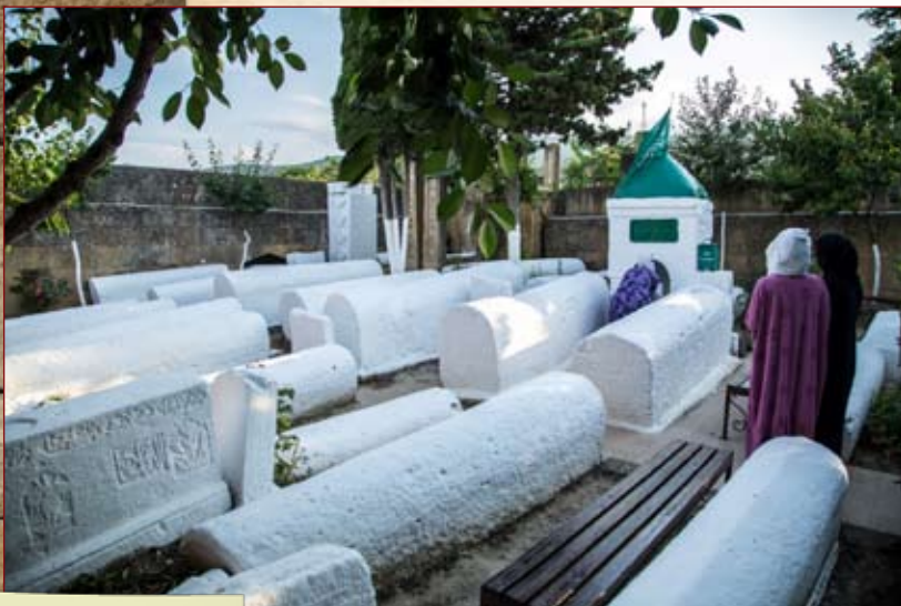
Блажен, кто верует

Сами же надгробия представляют собой саркофаги, состоящие из единого, выдолбленного внутри камня. Длина наиболее крупных надгробий достигает 3,2 м, высота – 0,8 м, ширина – 0,7 м, толщина – 10–12 см.