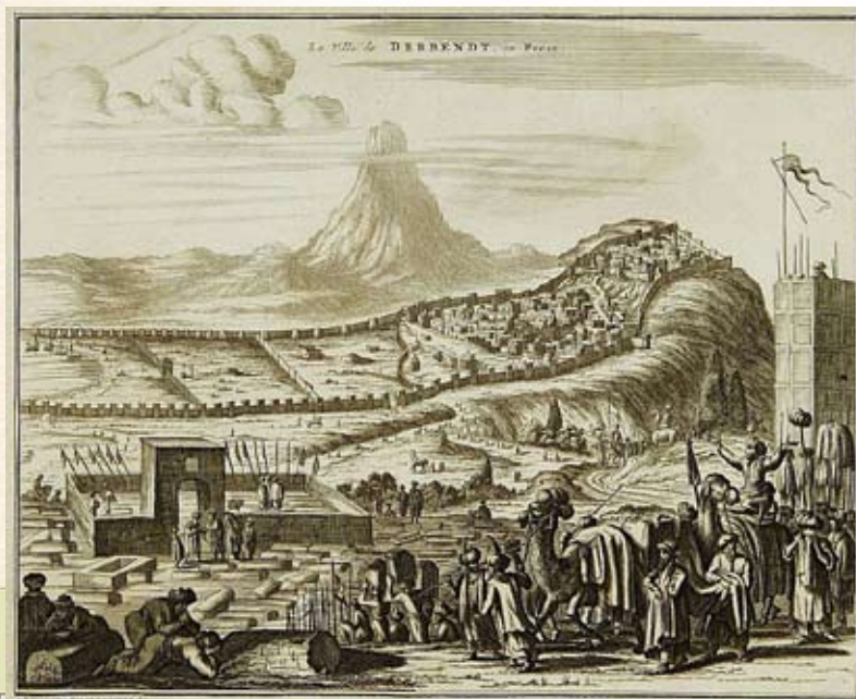
Дербент. Гравюра Адама Олеария. 1637 г. На переднем плане в огаде – захоронение Кырхляр

Возникновение этих могил местные источники и предания связывают с именами арабских шахидов – борцов за распространение ислама. Полагают, что здесь захоронены тела 40 воинов – мучеников, погибших в сражении с «неверными» хазарами у стен Дербента в 22 г. хиджры (642/643 г.). Отсюда и название комплекса Кырхляр (тюрк. Сороковик).