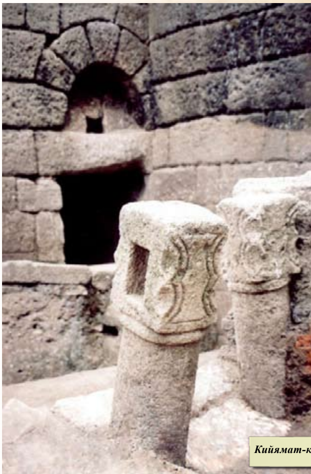
Кийямат-капы после раскопок

По свидетельству Д. Кантемира (1722 г.), местное население в его время это место считало святым.