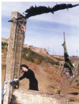
Пир Сейид Зека