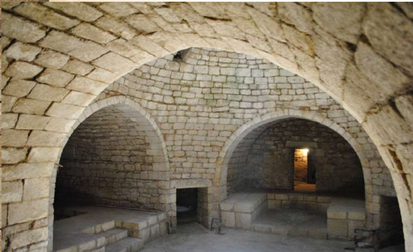
Интерьер моечного отделения Женской бани