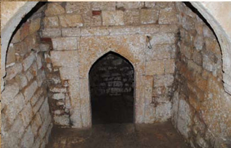
Входной портал Женской бани

Четвертая баня около Джума-мечети (Женская баня)».