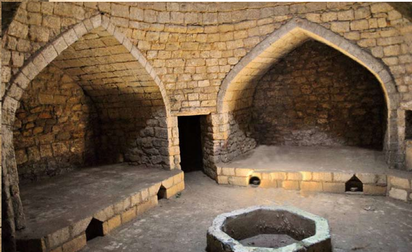
Интерьер холодного отделения Женской бани