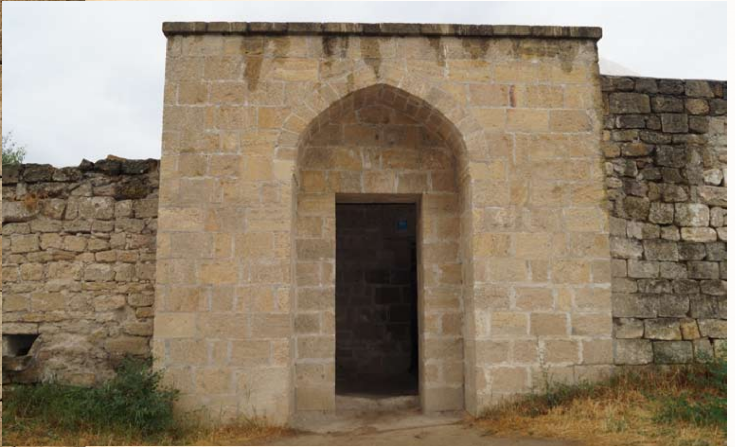
Фасад Ханской бани