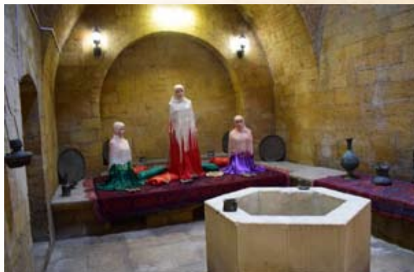
Девичья баня. Фрагмент интерьера холодного отделения