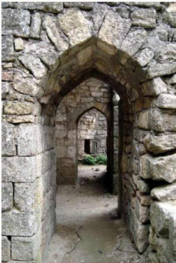
Ханская баня. Фрагмент внутреннего интерьера