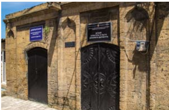
Фасад Девичьей бани