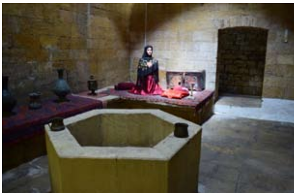
Девичья баня. Фрагмент интерьера холодного отделения