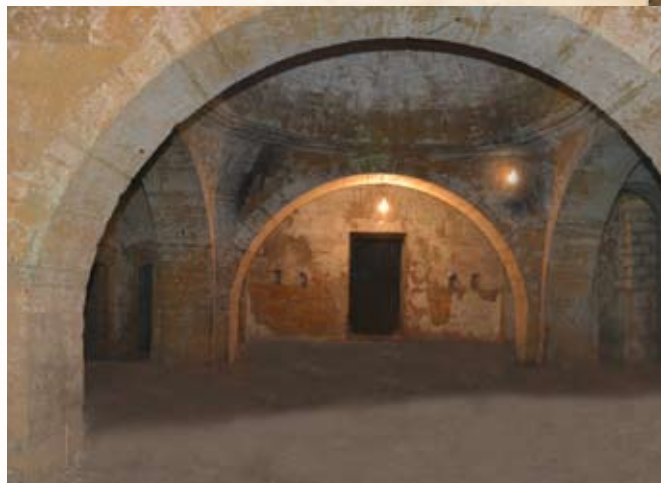
Интерьер Персидской бани