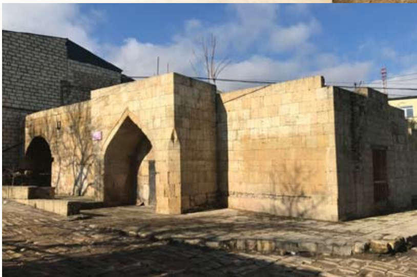
Фасад Мужской бани

Из описания древностей города, составленного по поручению военного коменданта Дербента одним из местных грамотеев в 1838 г., известно, что в городе «... Бань че-