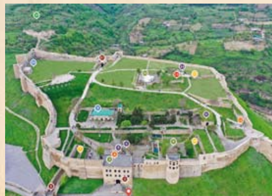
АРХИТЕКТУРНЫЙ КОМПЛЕКС ЦИТАДЕЛЬ НАРЫН-КАЛА

И тот, кто посетит древний город, познакомится с его историей, надолго запомнит дни, проведенные в этом удивительном городе легенд, городе-музее на берегу Седого Каспия.