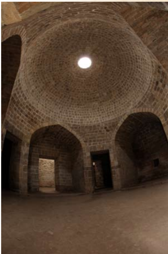
Ханская баня. Интерьер холодного отделения