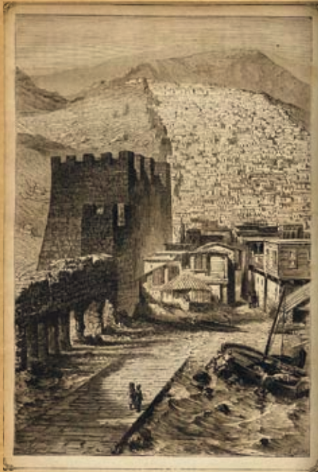
Дербент. «Народы России». Живописный альбом (СПб., 1877 г.)