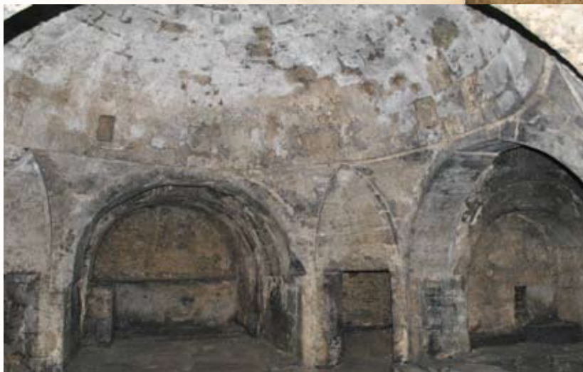
Фрагмент интерьера моечного отделения мужской бани

В центр уложенного каменными плитами пола водоема (хязня) вершиной вниз вмазан воронкообразный кованный из красной меди