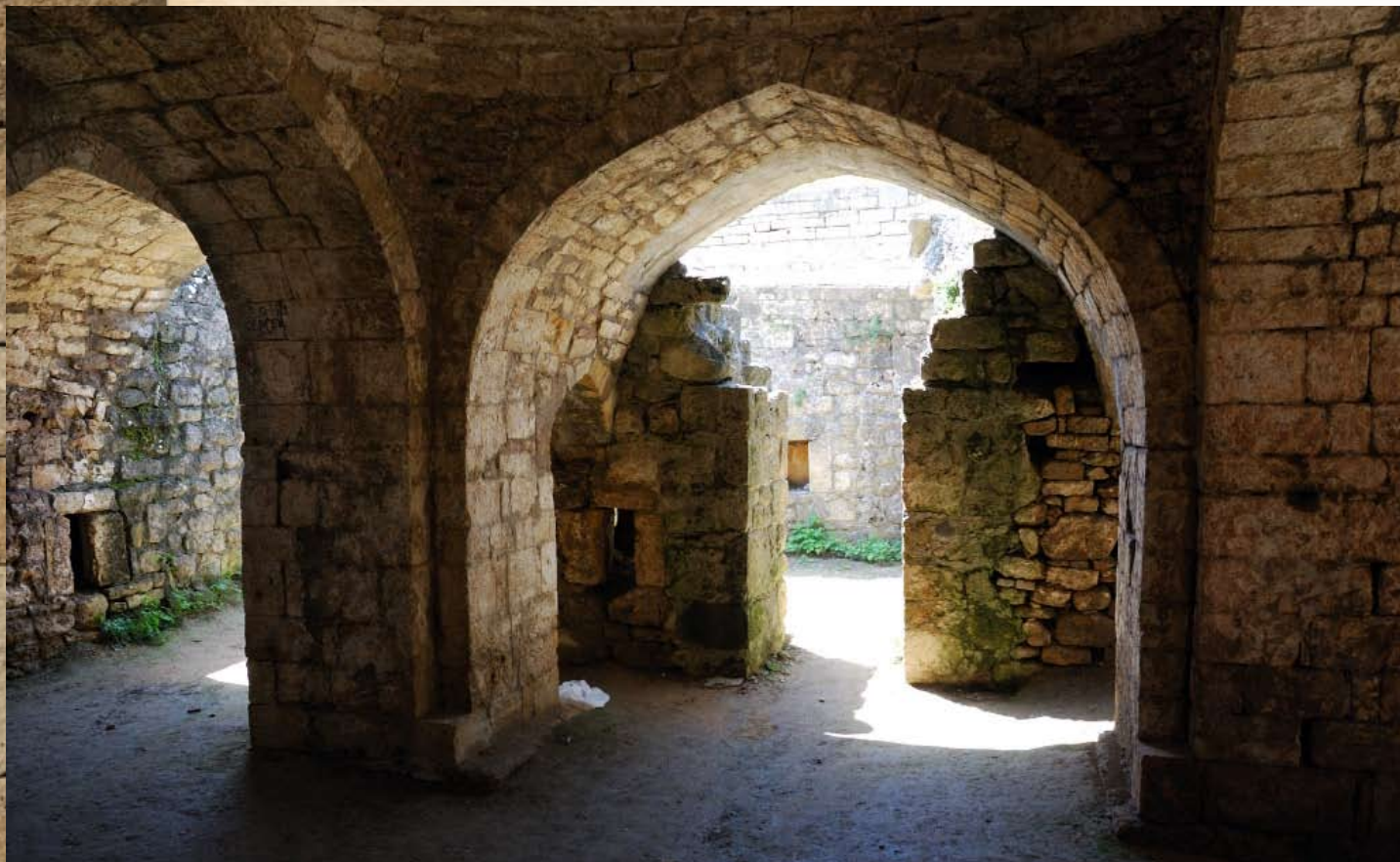
Ханская баня. Фрагмент внутреннего интерьера